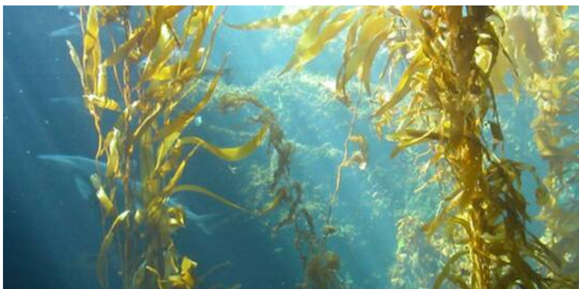
Rong biển có chứa Fucoidan tại Nhật Bản